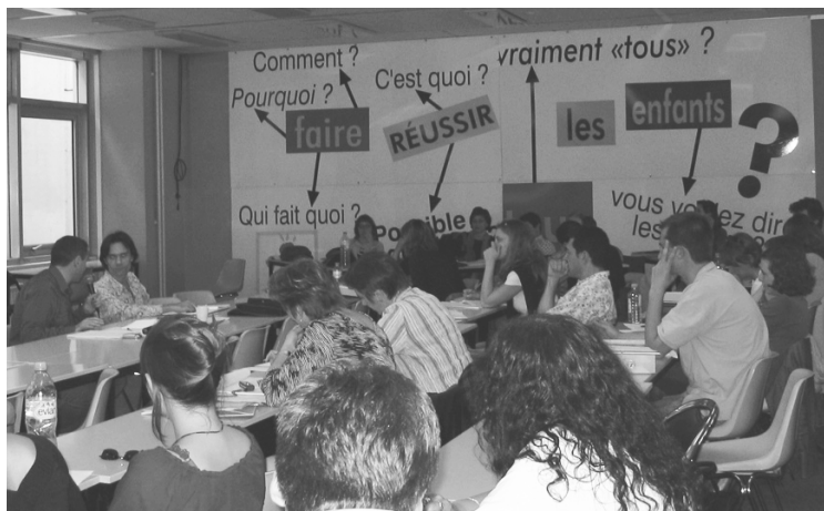
Le SNUipp organise régulièrement des rencontres avec les AVS, dans les départements ou nationalement.

Le SNUipp se prononce pour un plan de professionnalisation des AVS. Ce plan doit permettre d'ouvrir des discussions avec l'ensemble des partenaires pour aboutir.